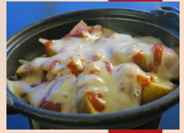
ジャーマンポテト ¥ 550