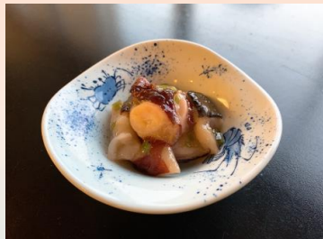
【南三陸産】蛸山葵 (たこわさび) ¥ 1,100