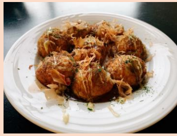
たこ焼き ¥ 450