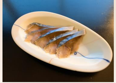
【宮城産】金華 (きんかしめさば) ¥ 550