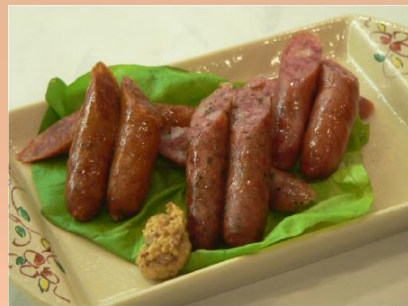
【仙台名物】牛タンソーセージ ¥680