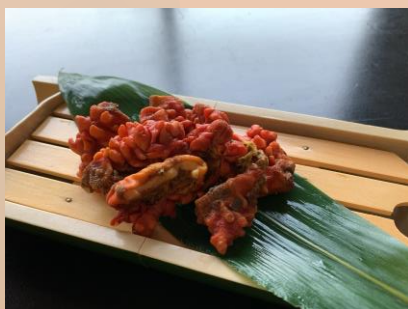
【宮城産】 蒸し海鞘(ほや) ¥1,100