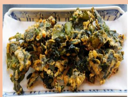
【三陸産】 わかめの唐揚げ ¥680