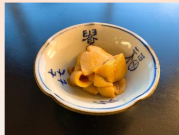
【宮城産】 海鞘(ほや)の塩辛 ¥ 450