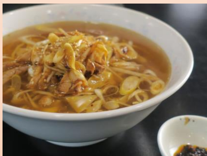
ピリ辛醤油ラーメン ¥1,200