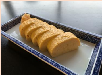
だし巻き玉子 ¥ 450