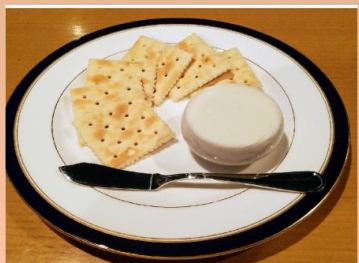
蔵王クリームチーズ ¥ 500