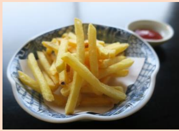
フライドポテト ¥ 450