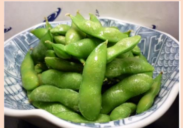
枝豆 ¥ 550