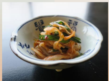
キムチ ¥ 300