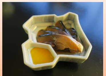
【宮城産】金華 (きんかさばづけ) ¥ 550