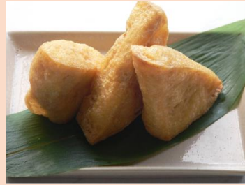
【秋保名物】三角油揚げ ¥ 400